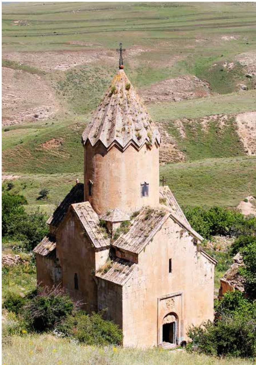
Рис. 7. Церковь Катогики монастыря Ованнес Карапет. 1301.