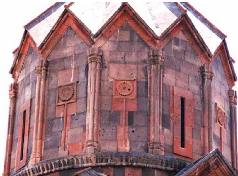
Рис. 2. Барабан церкви Сурб Карпет монастыря Ованнаванк. 1216–1221 гг. Фрагмент.

ми членениями на барабане была заимствован из Аричаванка. Тем более, что на фасадах церкви Сурб Карпет также присутствуют протяженные тяговые композиции, завершающиеся крестом. Зигзагообразный карниз зонтичного шатра с выкружкой покрыт лентой орнамента растительного характера. По нижнему краю карниз обрамлен вереницей полукружий 2 . Щипцы под карнизом шатра не имеют никакого декора. Современный вид купола является результатом реставрационных работ 1970–1990-х гг. (Тверитнева 2023). Возможно, что первоначальные каменные блоки щипцов были украшены рельефным декором, что свойственно купольным главам такого типа в это время, но были утрачены вследствие землетрясения 1919 г. или не вставлены на прежнее место в ходе реставрации.