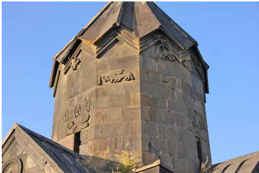
Рис. 6. Барабан церкви Сурб Степанос монастыря Танаат. 1273–1279. Фрагмент. Фото автора, 2012