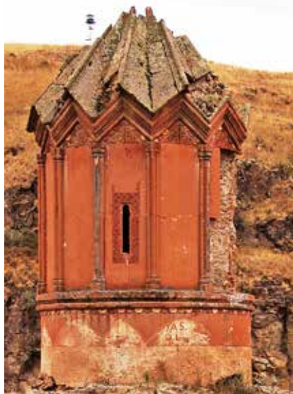
Рис. 4. Купольная глава шестизкседровой церкви Девичьего монастыря, Ани. Первая треть XIII в. Фото автора, 2014