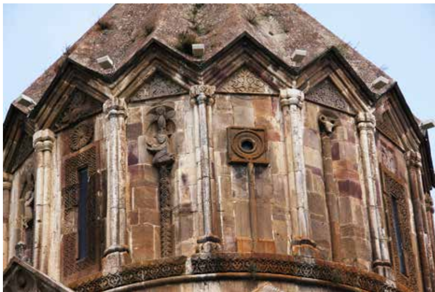
Рис. 3. Барабан церкви Сурб Ованнес Мкртич монастыря Гандзасар. 1216–1238 гг. Фрагмент.

Рассмотренные выше примеры относятся к крупным монастырским соборам и происходят из областей Армении, чьи территории освобождались вместе с распространением власти анийских правителей Закарян. Что же касается самого Ани, то этот тип купольной главы, характерный именно для Анийской столичной архитектурной школы эпохи Багратидов, также нашел свое воплощение в городской застройке начала XIII в. Однако масштаб анийских церквей с реберно-колончатым барабаном значительно уступает масштабу названных ранее построек из Аричаванка, Ованнованка и Гандзасара. Речь идет о миниатюрных церквях Сурб Григор (известная более как Бахтагека или Хачута) и шестиколончатой церкви Девичьего монастыря (Кусанац ванка 3 ). Обе эти постройки не имеют источников о времени строительства и имен заказчиков, традиционно их датируют первой третью XIII в. (Лошкарева 2020). Об убранстве барабана церкви Сурб Григор мы можем судить по известному рисунку реконструкции по Т. Тораманяну, где довольно условно пока-